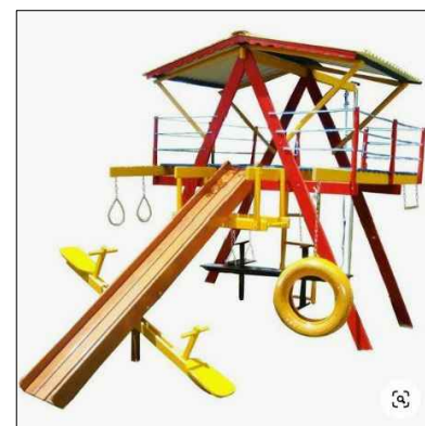
IMAGEM REFERENCIAL DO PLAYGROUD