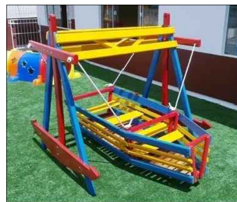
IMAGEM REFERENCIAL DO BARCO BALANÇO