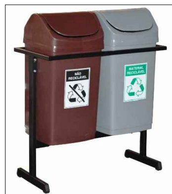
IMAGEM REFERENCIAL DA LIXEIRA SELETIVA