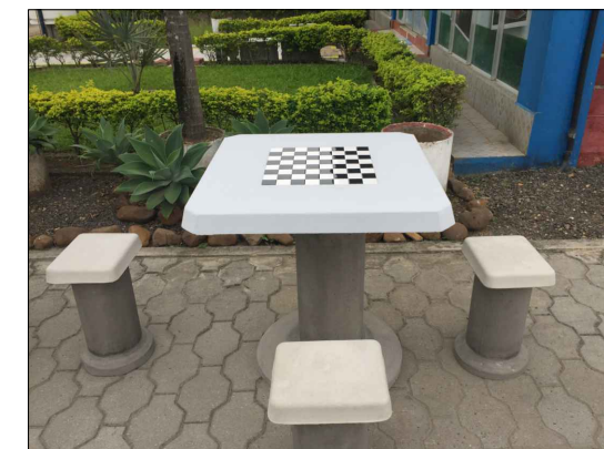
IMAGEM REFERENCIAL DO CONJUNTO MESA E BANCOS DE CONCRETO