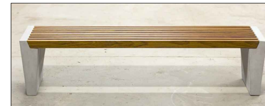
IMAGEM REFERENCIAL DO BANCO SEM ENCOSTO