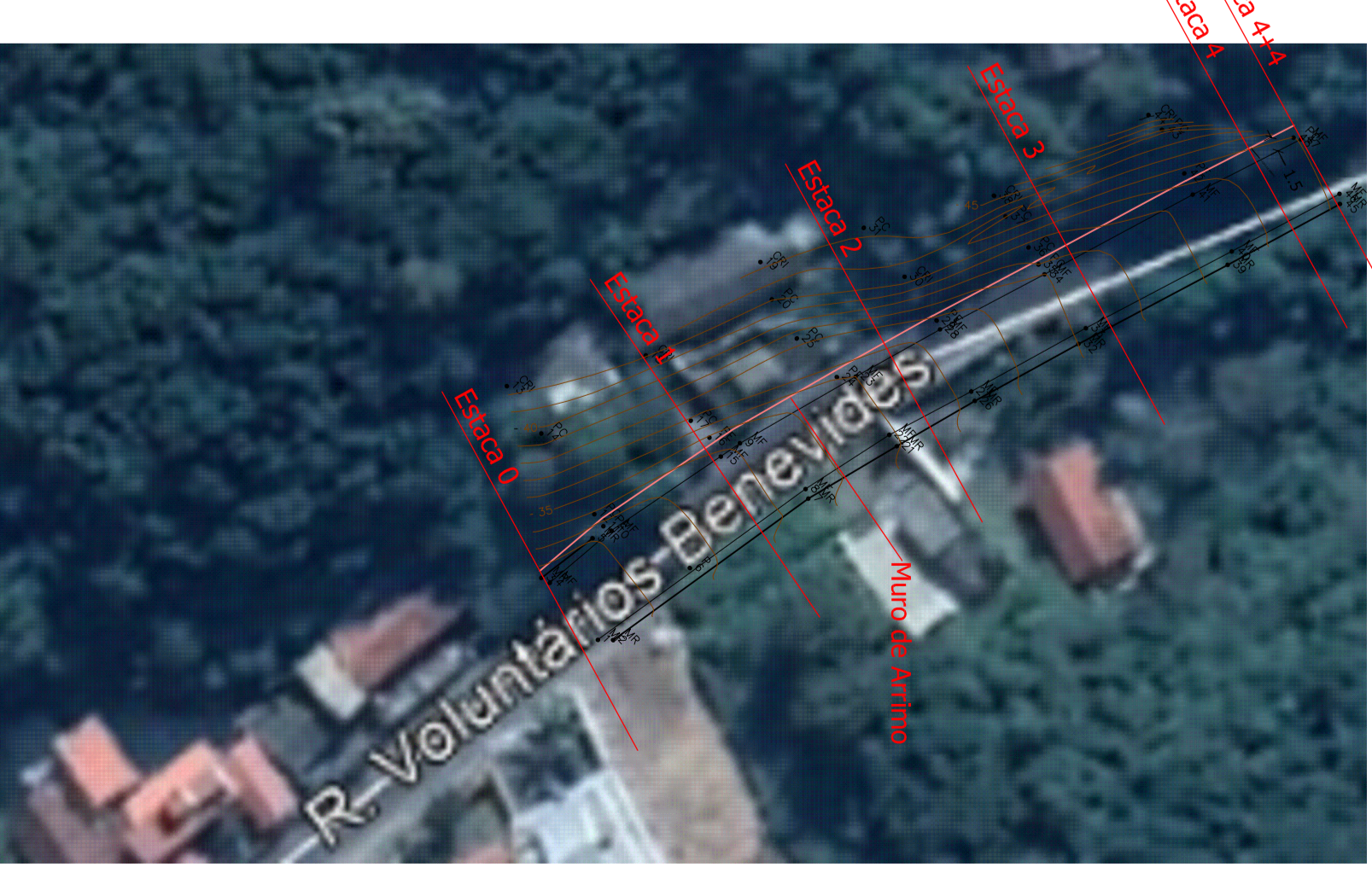
PLANTA DE LOCALIZAÇÃO Escala ..... 1/500

PERFIL LONGITUDINAL Escala Horizontal..... 1/50 Escala Vertical..... 1/25