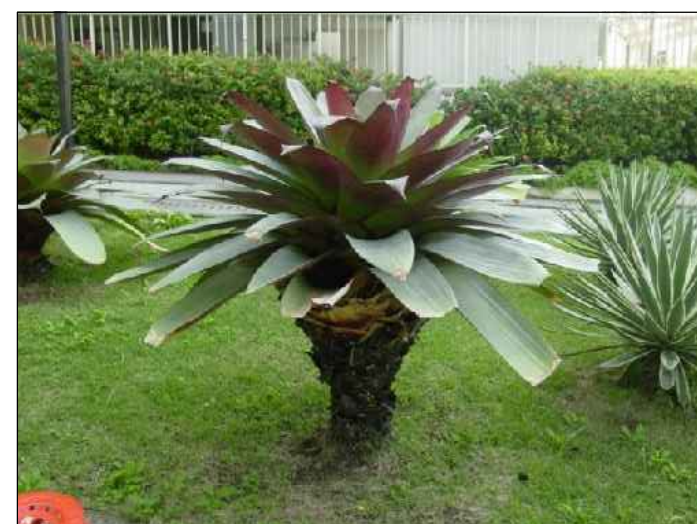
IMAGEM REFERENCIAL DE BROMÉLIA IMPERIAL