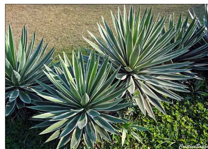
IMAGEM REFERENCIAL DE ÁGAVE