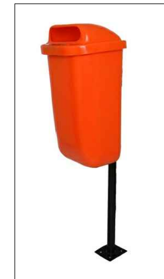
IMAGEM REFERENCIAL DA LIXEIRA