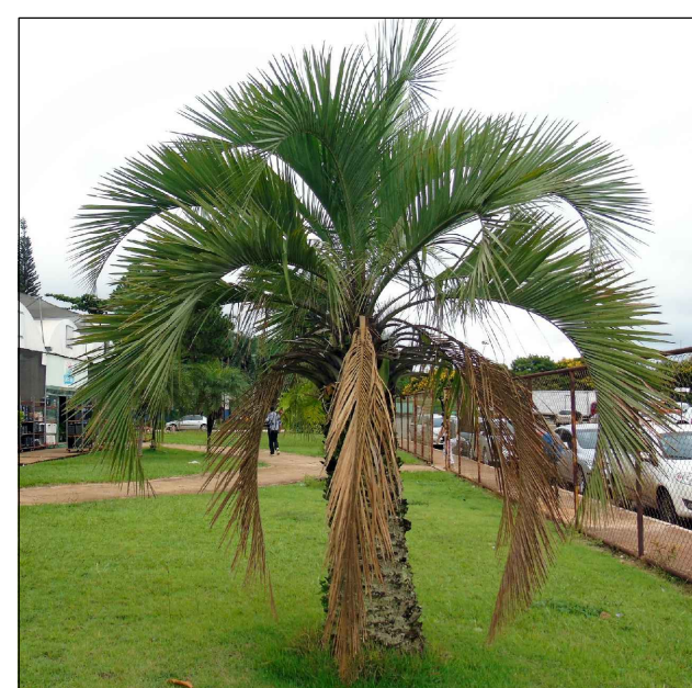
IMAGEM REFERENCIAL DE BUTIÁ