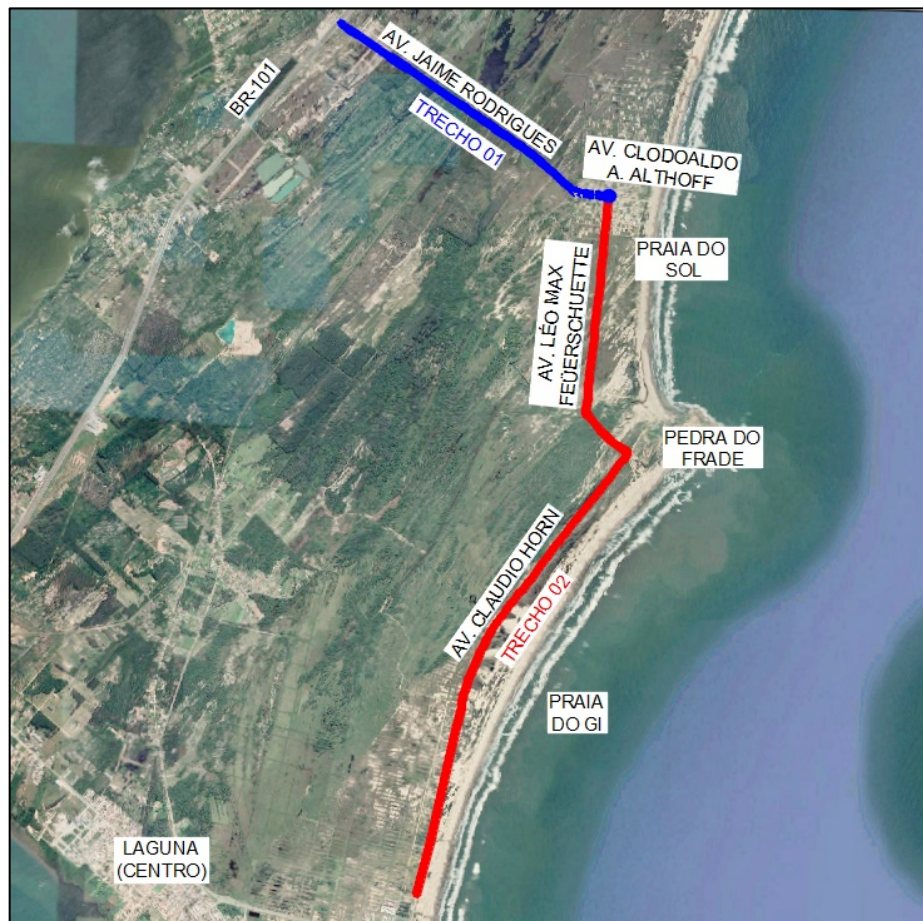
Figura 2: Traçados das vias atingidas.

Os Levantamentos Topográficos foram executados pela Prefeitura Municipal de Laguna, durante o mês de julho e agosto de 2021 e tiveram como objetivo conhecer a situação atual das vias, fornecendo os dados de geoposicionamento necessários para a elaboração dos projetos. Todos os projetos foram elaborados com base nas informações obtidas nos levantamentos topográficos elaborados e enviados pela Contratante.