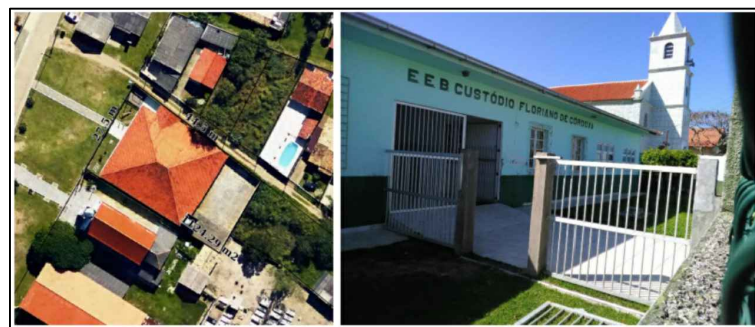
3 IMAGEM AÉREA / FOTO Sem Escala