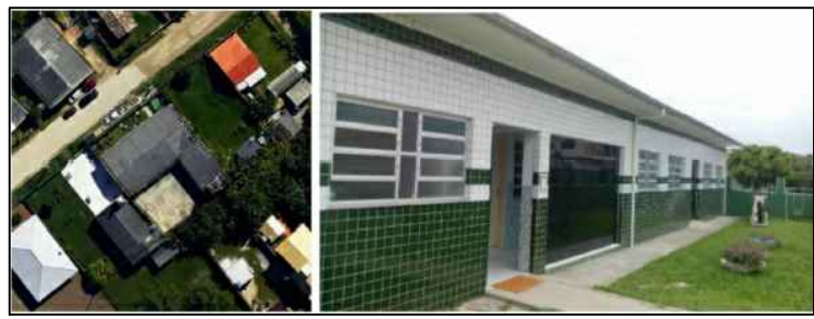
3 IMAGENS Sem escala