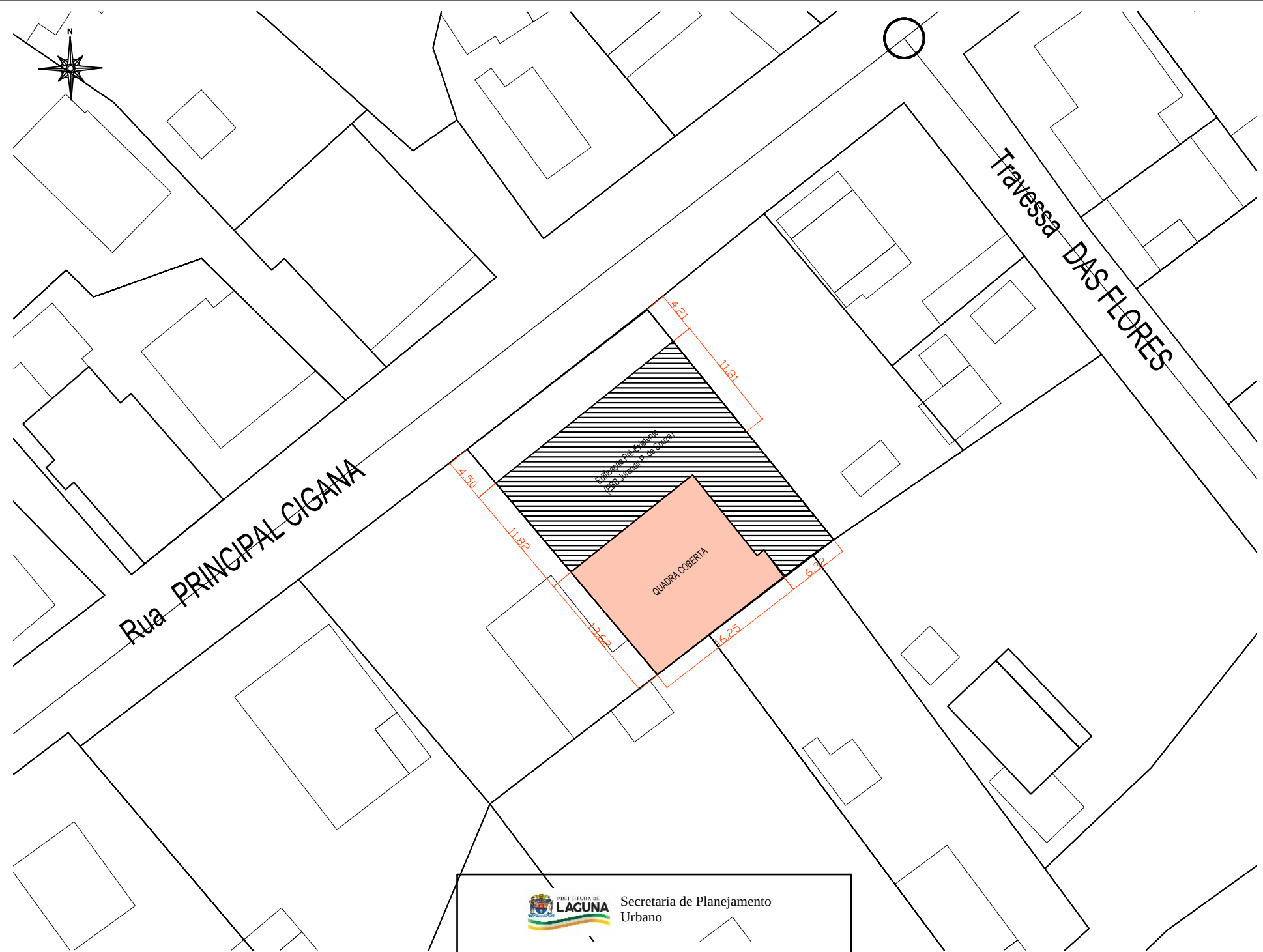
2 LOCAÇÃO Esc. 1:500