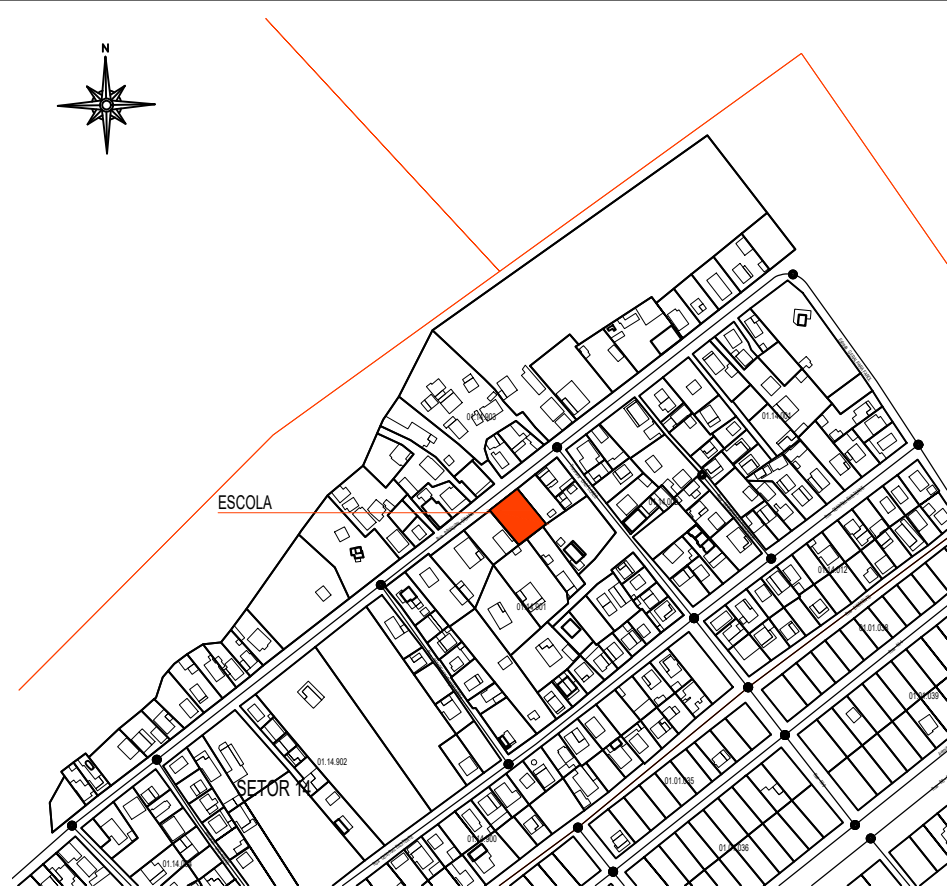
1 SITUÇÃO Esc. 1:5000