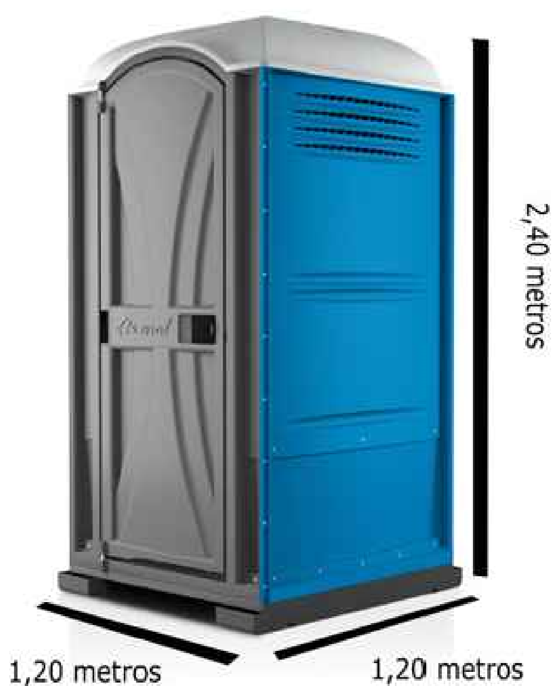
03 - BANHEIRO QUÍMICO (REFERÊNCIA) Sem Escala