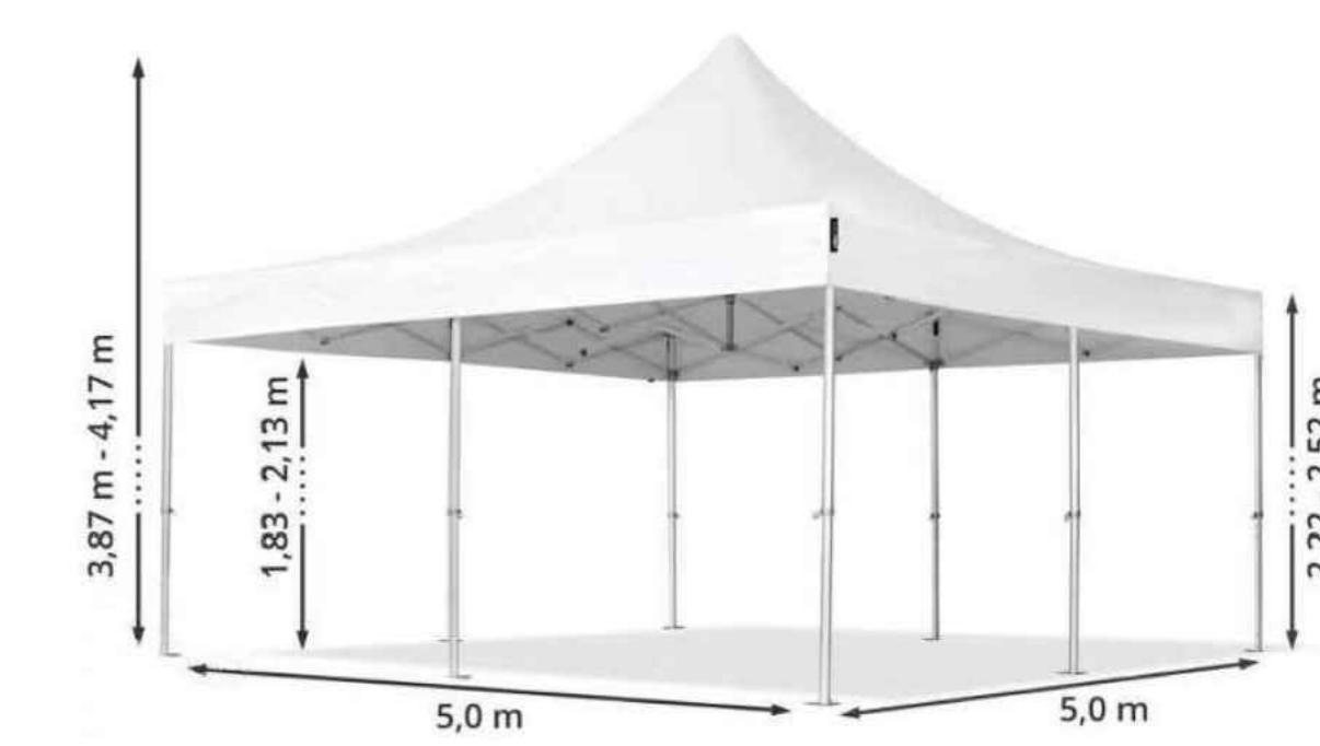
02 - TENDA DE 5,0 x 5,0 M (REFERÊNCIA) Sem Escala